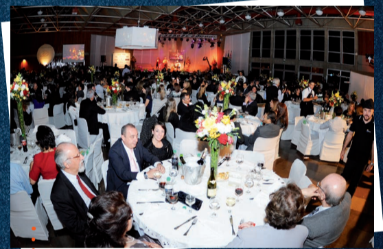
Dia da Empresa Limeirense, em 2013