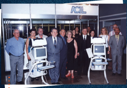
..... Feira de Informática, Automação e Telecomunicação (Informax) promovida pela ACIL em 2001

Em 1933 circunstâncias ligadas ao desenvolvimento da cidade e conseqüente crescimento de suas atividades econômicas levaram empresários limeirenses a pensar na constituição de um órgão de classe.