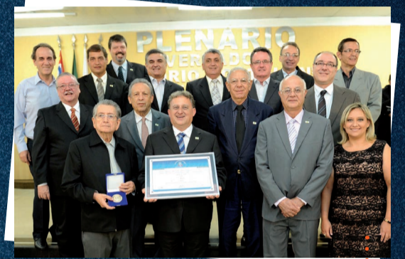
Recebendo o Diploma de Gratidão da Cidade de Limeira, em 2013