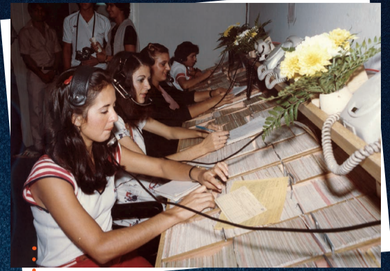
SCPC na década de 80

Além disso, em 2016 a Associação estará concluindo o sistema de gestão qualidade baseado na ISO9001/2008 para que continue a ter o reconhecimento dos associados na representatividade ativa, na qualidade da prestação de serviços e na participação efetiva no desenvolvimento socioeconômico da região de Limeira.