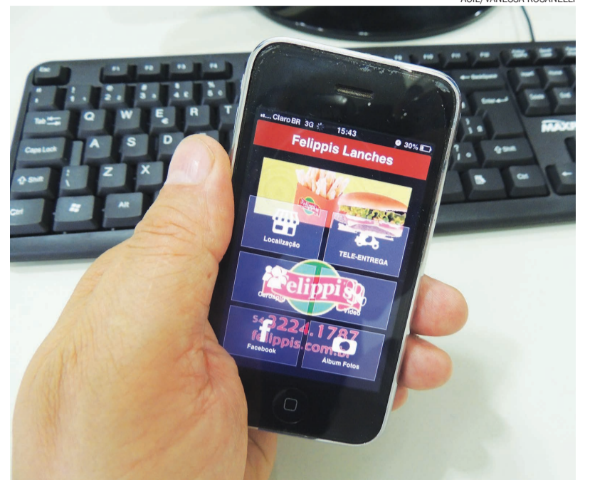
Produção, gravação e transmissão de vídeos para cobertura de eventos, e criação de aplicativos são os principais serviços disponibilizados pela empresa