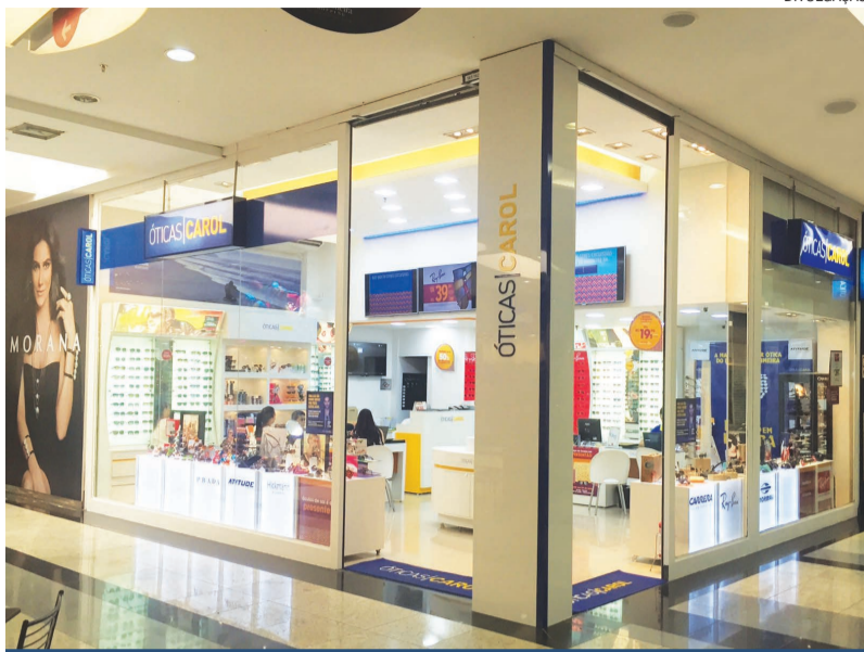
A nova Óticas Carol conta com um espaço mais amplo, um mix maior de produtos e também já é considerada a mais bonita da cidade

No último dia 14, a Óticas Carol reinaugurou sua loja no Pátio Limeira Shopping. A reinauguração contou com a presença especial do Ator Sérgio Marone, que interpreta o personagem Ramsés, na novela “Os Dez Mandamentos” exibida na Rede Record. Sérgio Marone é considerado um dos melhores atores do ano 2015, devido ao grande sucesso da novela nacionalmente.