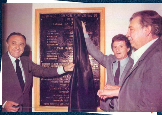
Inauguração da sede da ACIL na Rua Santa Cruz, em 1984