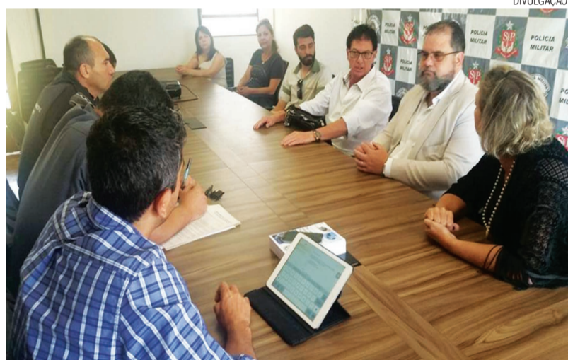
O encontro foi organizado após o recebimento de um ofício contendo um abaixo-assinado com cerca de 50 assinaturas de comerciantes da região

Reunião discutiu ações a serem tomadas para reforçar a segurança do comércio do “Centro acima”